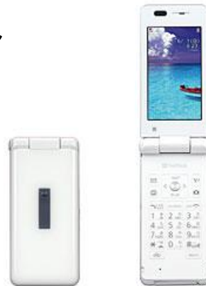
ピュアーホワイト