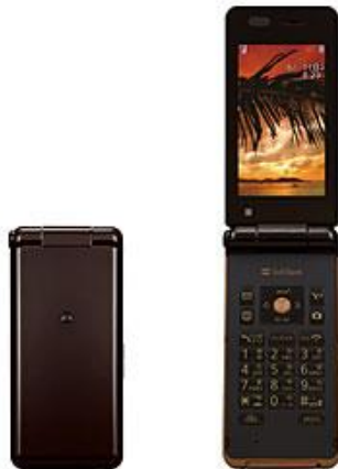
メイプルブラウン

加盟団体へは申し込みをいただいた台数分、2色の端末を同数ずつ出荷いたします。 メンバーへの配布は加盟団体内で調整ください。